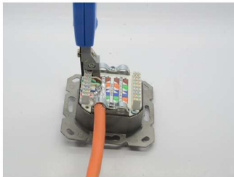
Aufschalten der Aderpaare mit LSA-Werkzeug Terminate the wires with LSA impact tool