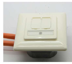
Aussenring adapterplatte und Zentralplatte befestigen Fasten cover plate adapter plate, and mounting plate