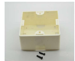
Unterrahmen wählbar Under frame choosable