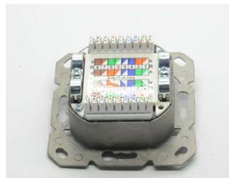
Farbcode oder Nummerncode wählen Choose colour-code or number-code