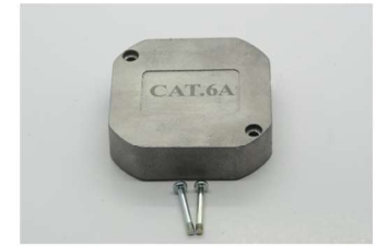
Abschirmdeckel mit Zwei Schrauben Rear screen plate, screwable