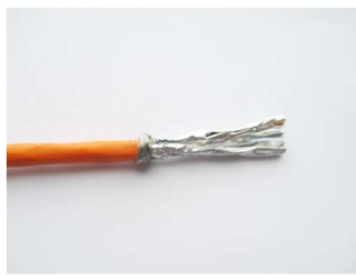
Vorbereiten der Kabelabschirmung Prepare the shielding