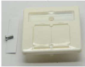
Zentralplatte 50*50mm mit Beschriftungsfeld Mounting plate 50*50mm incl. Marking field