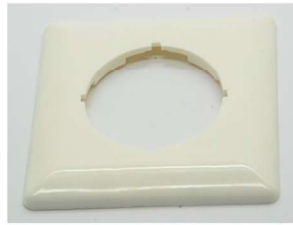
Aussenplatte 80*80mm Cover plate 80*80mm