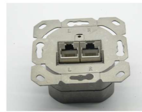
Metalplatte mit 2 geschirmten RJ45 Buchse Metal plate with 2 shielded RJ45 sockets