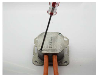
Abschirmdeckel festschrauben Tighten rear screen plate